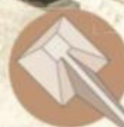
Direta e reta A rampa era elevada junto com a pirâmide