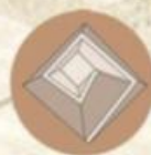
Espiral A rampa dava voltas na obra