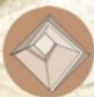
Fora pra dentro Externa na base e interna no topo

A parte externa foi revestida de calcário brilhante, extraído de uma pedreira. Há indícios de que a ponta tinha folhas de ouro. O reflexo fazia a construção ser vista a quilômetros de distância. Ao lado dela, três pequenas pirâmides eram, provavelmente, dedicadas às esposas do faraó